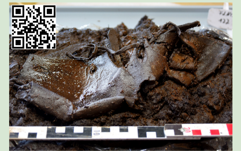
Ein seltenes Fundstück: Ein 2000 Jahre alter Lederschuh

Teile des Bohlenweges Pr VI und andere Funde können u.a. im Industriemuseum in Lohne und im Landesmuseum Oldenburg besichtigt werden. Im Dümmer-Museum kann die Besiedlungsgeschichte des Dümmerraaumes in der Ausstellung nachverfolgt werden. Ein Film über die Ausgrabung des prähistorischen Weges und über den Bau des neuen Moorstegs ist im Internet verfügbar. Er heißt: „Zwei Wege im Moor“.