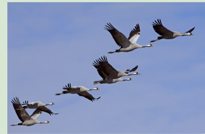
Kraniche kommen im Herbst zur Rast in die Moore

Der östliche Teil des Naturparks ist durch weite Moorlandschaften geprägt. Die Moore der Diepholzer Moorniederung haben für den internationalen Vogelschutz eine besondere Bedeutung. Tausende von Kranichen, Gänsen und Wiesenvögeln machen hier Rast. Vor allem in den frühen Morgenstunden und zum Sonnenuntergang erwartet Besucherinnen und Besucher ein einzigartiges Naturschauspiel, wenn die „Vögel des Glücks“ aus ihren Gebieten aufsteigen bzw. in sie einfliegen.