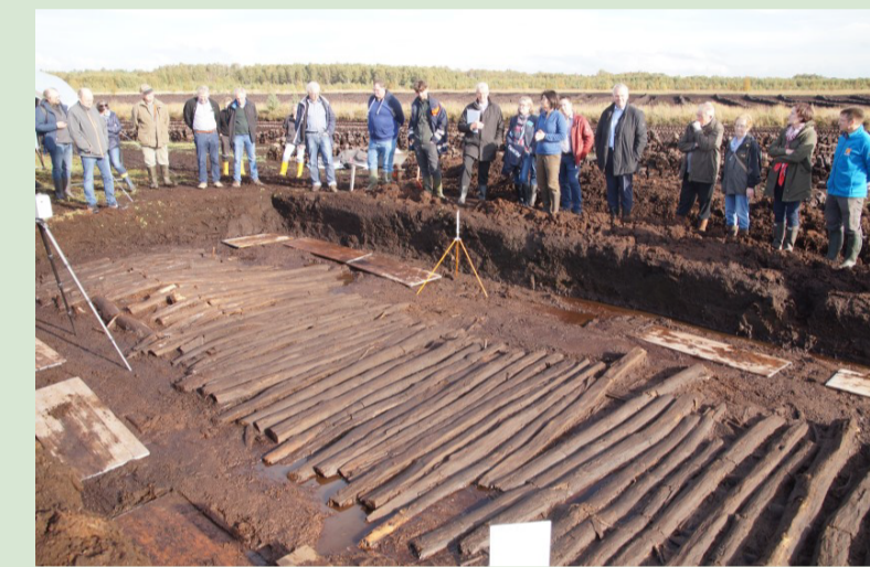
Freigelegter Abschnitt des Bohlenweges Pr VI im Süden der Lindloge

Für dieses Bauwerk war besonders viel Holz und eine meisterhafte Bauleistung notwendig. Dendrochronologische Untersuchungen ergaben, dass die Bäume in der späten vorrömischen Eisenzeit um das Jahr 46 v. Chr. gefällt und verbaut wurden.