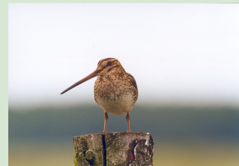
Bekassine auf einem alten Holzpfahl

Die Begehung ist ausschließlich auf den hierfür markierten Wegen gestattet. Hunde sind ganzjährig anzuleinen.