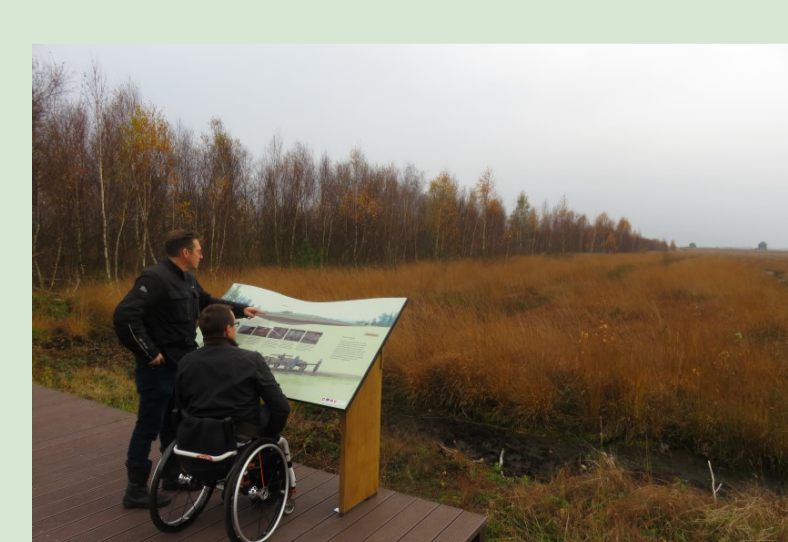
Der Moorsteg bietet die Möglichkeit für ein barrierearmes Naturelebnis

Das Gebiet präsentiert sich zurzeit sowohl als Abbaufäche für Torf, beinhaltet aber auch wiedervernässte Bereiche, die den moortypischen Pflanzen und Tieren Lebensraum nach der menschlichen Nutzung bieten. Nach dem Ende des Torfabbaus wird die komplette Wiedervernässung für das Gebiet eingeleitet.